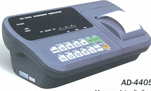
AD-4405 Kompakt çözüm