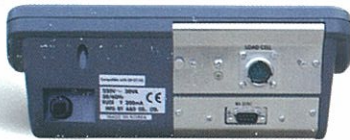
AD-4405 Arka Görünüm